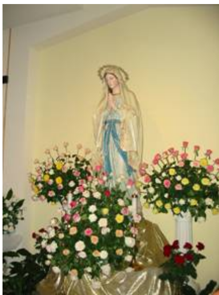
A Lourdes-i Szűzanya szobra

Ezután eltűnt. A kis Danijel egy idő után pedig teljesen meggyógyult.