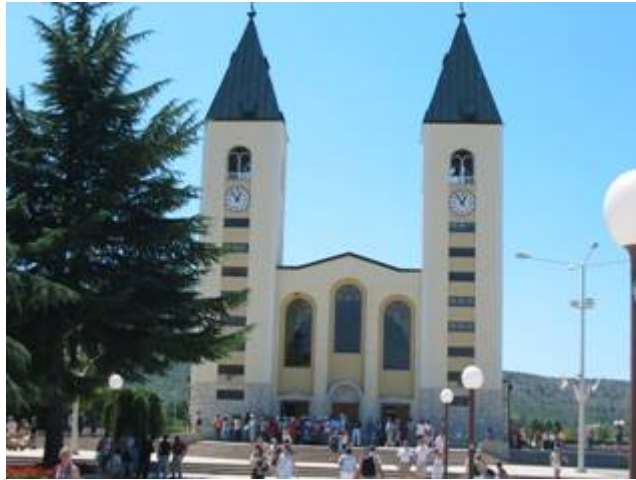
Szent Jakab templom