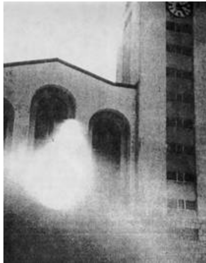
Fényjelenség egy felvételen

A szentmisét Stanko Dodig kapucinus atya mutatta be, aki Fiuméből érkezett haza évi szabadságra. De nem volt jelen fra Stanko Vasilj sem, mert őt és még két másik ferencest is letartóztatták és Čitlukba vitték kihallgatásra. A plébániahivatalban még mindig zárva tartották fra Zrinkót és a tisztelendő nővéreket, akiknek megtiltották, hogy átmenjenek a templomba. Amíg az oltár melletti kápolnában a jelenés zajlott, a kívül rekedt szemtanúk nagy fényességet láttak, amely leereszkedett a templomra.