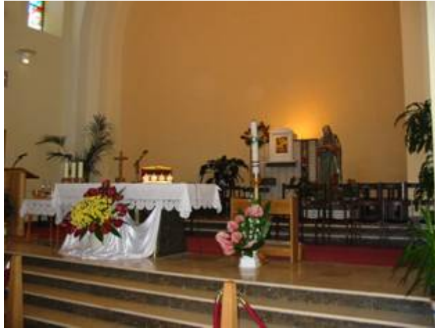
A templom oltára előtt

Hogy lehetséges, hogy a falu telefonközpontja éppen egy héttel az események kezdete előtt leégett? Hogy lehet mégis, hogy egész országokat, sőt még Európa is értesült a dolgokról egyetlen nap leforgása alatt? Az embereknek nem világos, hogyan történhetett mindez!