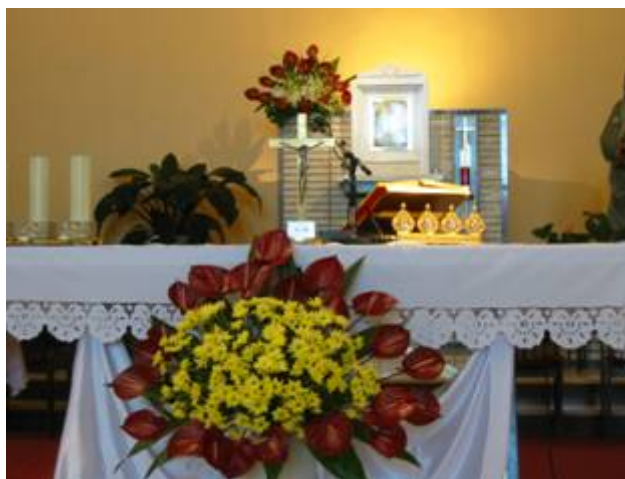
Oltár a Szent Jakab templomban