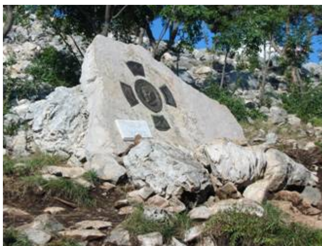
Halálának helyét ma kőtábla jelzi

Pénteki napon halt meg, a Križevacon végzett keresztút után, abban az órában, amikor a Megváltónk is kilehelte lelkét.