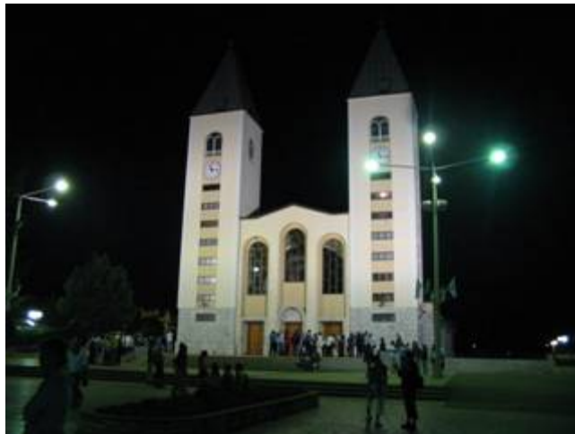
Szent Jakab templom éjjel

A templomban rendszeressé vált az esti program: