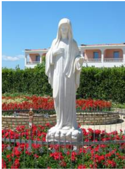
A Szűzanya szobra a templom előtti téren