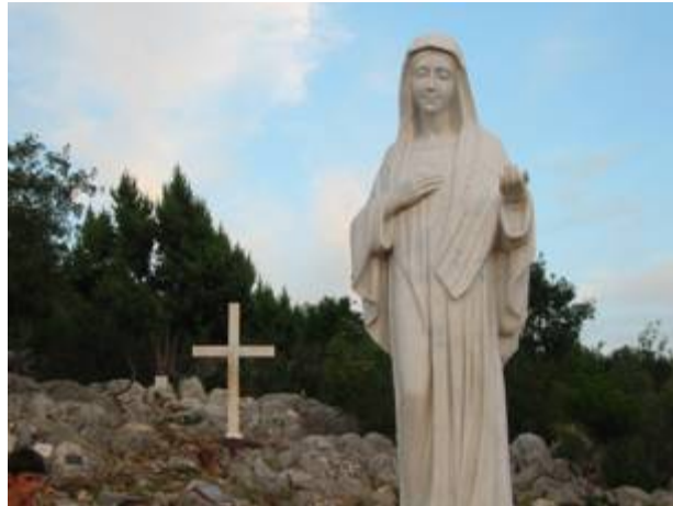
A jelenés helyén ma szobor áll