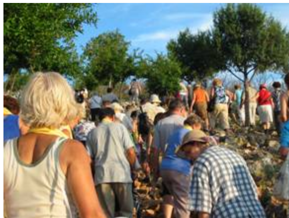
Zarándokok a Podbrdo hegyen

Az emberek sokasága, amely a jelenések színhelye felé tartott, már kora reggel nagyobb volt a szokásosnál. Az elviselhetetlen forróság - árnyékban mért 35°C - ellenére felmentek a hegyre.