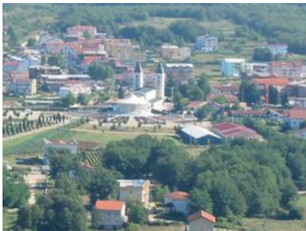
Međugorje látképe a Križevacról

Međugorje /ejtsd: Megyugorjé/ Nyugat–Hercegovinában Mostartól délre Assisi magasságában helyezkedik el a 43. szélességi fokon.