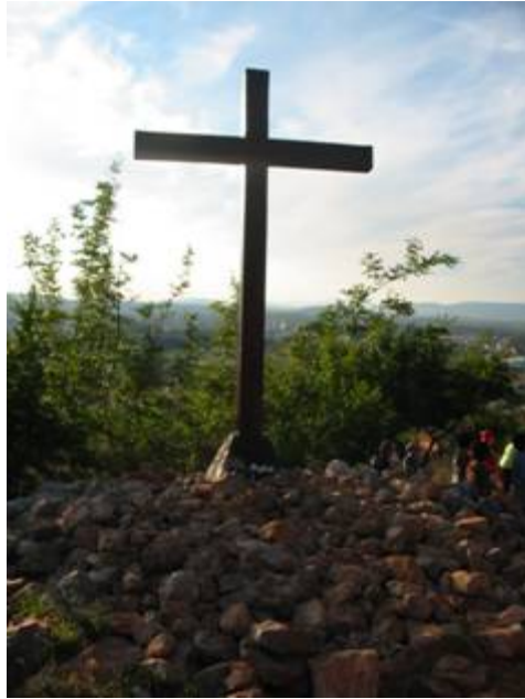
Az első jelenés helye a Podbrdon

A Boldogságos Szűzanyát gyakran faggatták egyes betegekről, vajon meg fognak-e gyógyulni. Így válaszolt: