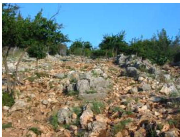
A Podbrdo hegy